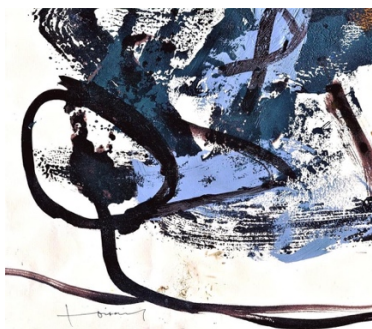
Peinture C. Voisard.